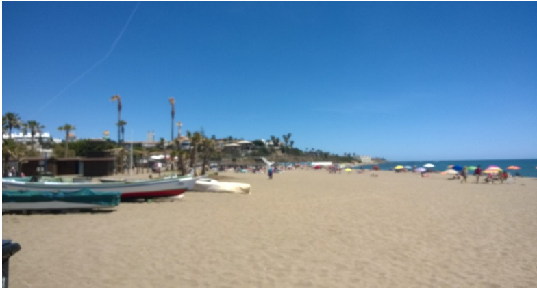
Tuliaissuklaat meinasivat sulaa +25 asteen lämmössä